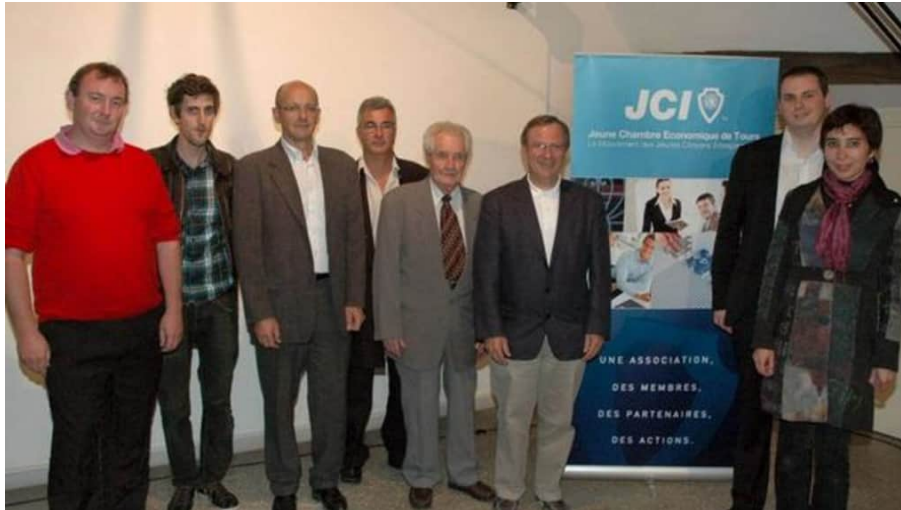
Les lauréats accompagnés de quelques représentants de la Jeune Chambre économique.

Publié le 25/06/2012 à 05:29 | Mis à jour le 28/04/2017 à 03:26